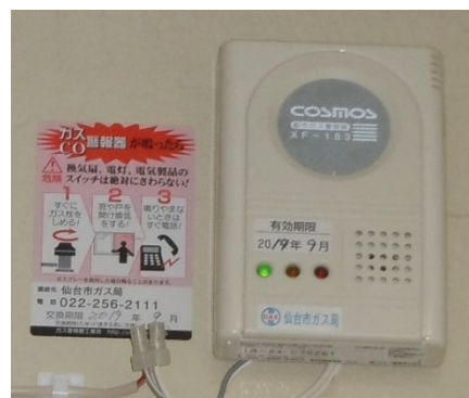
調理場東面壁上部に警報機設置